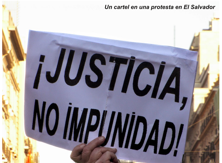
Un cartel en una protesta en El Salvador

El Comité Olímpico sostiene que ISDS ha superado su procedimiento ético. Para nosotrxs, eso no quiere decir que ISDS es una empresa aceptablemente ética, sino demuestra un fallo de los procedimientos del Comité Olímpico.